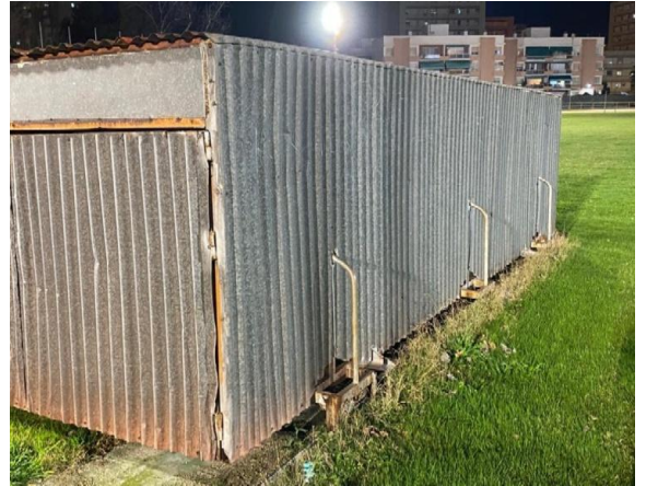
Hangar colchoneta de competición con puerta rota